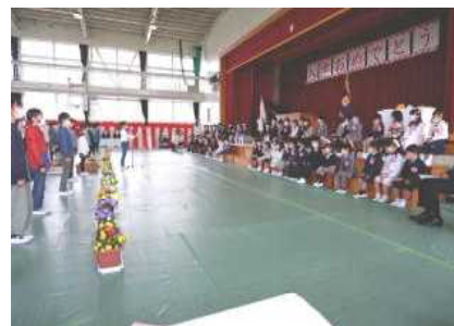
児童代表歓迎の言葉