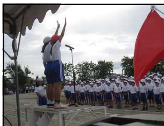
開会式「児童代表の言葉」

保護者の皆さま、地域の皆さま、そして御来賓の皆さま。上陽小学校の子供たちのために、学校にお越しいただきありがとうございました。当日は校庭の状態が悪く、内容を少し変更させていただきましたことをどうかご理解ください。また、朝早くからグラウンド整備に力を貸して下さった保護者の皆さま、どうもありがとうございました。そして、子供たちの頑張り、成長、雄姿に対して、たくさんの声援をいただきありがとうございました。