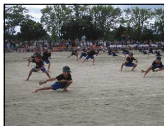
1・2年生「よさこいよっちょれ」