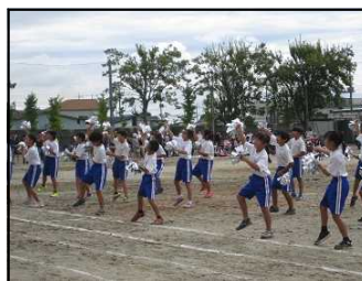
3・4年生「ダンシング・ヒーロー」