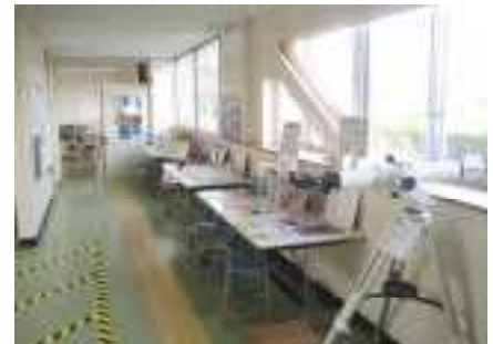
『理科室前コーナー』