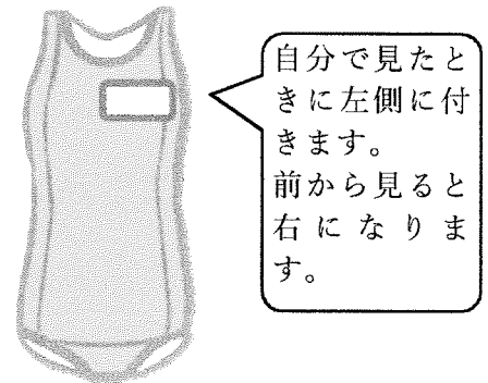
女子の水着の取り付け例