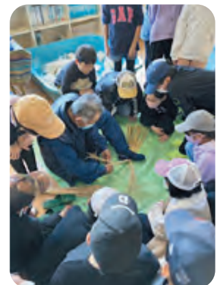
しめ縄づくりの様子(4年生)。農家の方に教えていただきました。

コロナ禍、各行事の開催を判断して下さった先生方や協力して下さった役員及び保護者の皆様に心より感謝申し上げます。