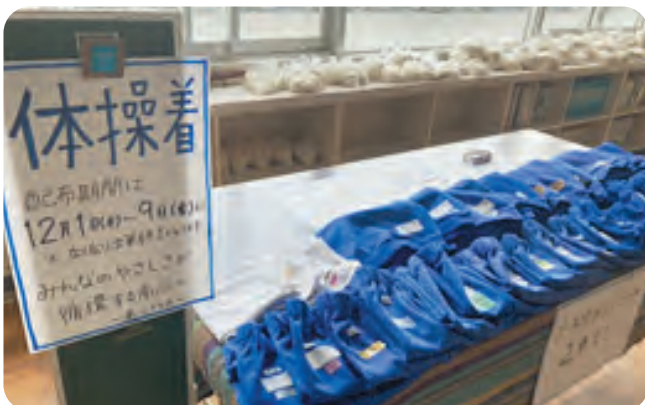
SDGsの一環として、着られなくなった体操着を皆さんからご提供いただき、リユース品として希望する方に配布を行いました。