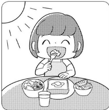
早起きして朝ごはんを食べよう