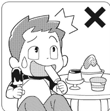
冷たいおやつを食べ過ぎない