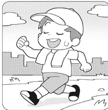
軽い運動をして汗をかこう