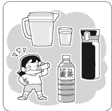
こまめに水分補給をしよう