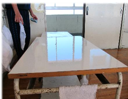
【窓が映り込むほどピカピカ】