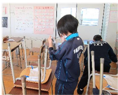
【脚の汚れを地道に削る】

授業中の姿も行事のがんばる姿も部活動に取り組んでいた姿も立派でしたが、こういう地道な単純なことに落ち着いて取り組めることも、とても大切だと思います。