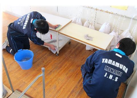
【下の部分もきれいに】