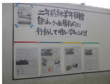
（新聞文集委員会：学級新聞）