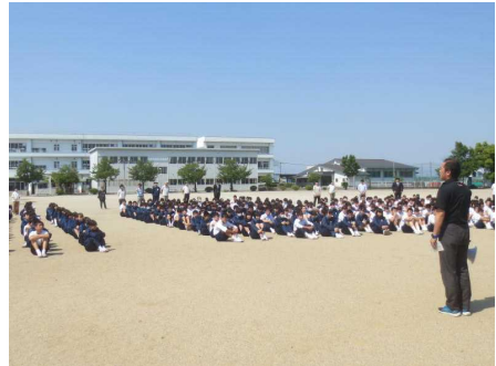
（校庭避難後の集合の様子）

なお、これから夏に向かいますが、落雷、竜巻、突風、ゲリラ豪雨等、天候の急激な変化に適切に対応できるようにしていきたいと思ひます。