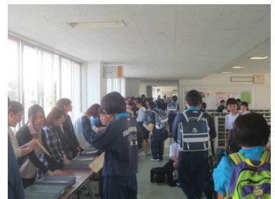
（生徒玄関での活動の様子）

今年度の南中PTA活動方針は、「心豊かでたくましく生きる力をもった生徒を育てるPTA」です。年間を通じて各部の活動が予定されていますが、ご協力の程、どうぞよろしくお願いいたします。