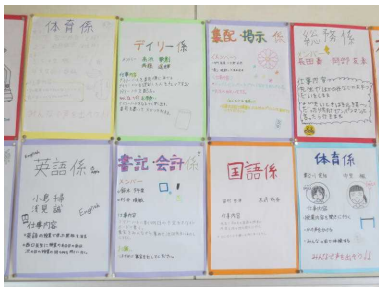
（係活動のめあて：1年生）

また、委員会活動も本格的に始まり、生活安全委員会による自転車点検、保健委員会による保健新聞、新聞文集委員会による学級新聞も掲示されたりしています。委員会活動における生徒の活躍も今後ご紹介していきます。