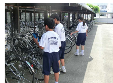
（生活安全委員会：自転車点検）