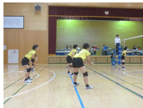
(バレーボール女子)