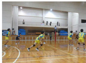
(バレーボール男子)