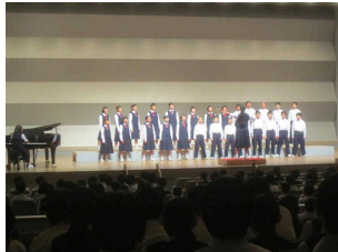
中～右：1-2, 2-2, 3-1