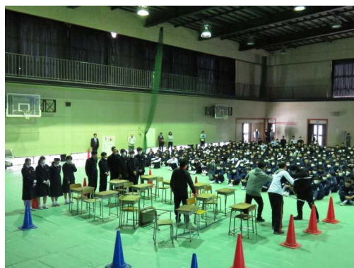
(体育館内での実演; 生活安全委員会)

また、不審者が侵入しにくい環境づくりとして、「整理整頓」と「あいさつ・声かけ」の大切さを生徒たちに伝えました。特に、「学校が整理整頓されていること」は、「少しの変化にも敏感に気付く学校」であり、「目配りや心配りができる学校」であることを意味しています。この観点からも、安全で安心な学校づくりを進めていきたいと思ひます。