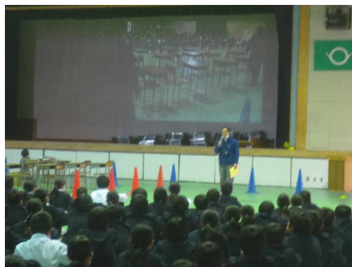
(場面ごとの振り返り; 安全担当)