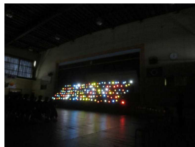
(2年生「ライトアート」)