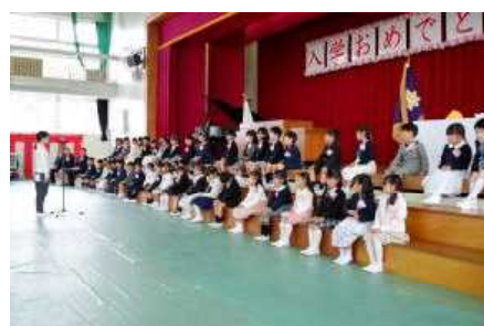
児童代表歓迎の言葉