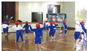
1年生の体育 (元気よく縄跳びしてます)